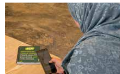
Jordaniassa pakolaisnaisia kannustetaan mm. IT-aloille ja yrittäjiksi.