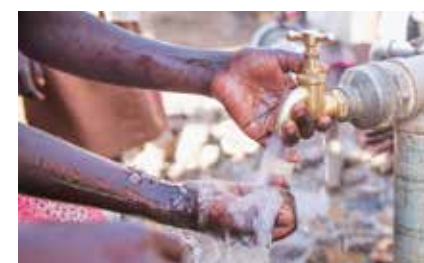
Sivun tekstit: Noora Pohjanheimo