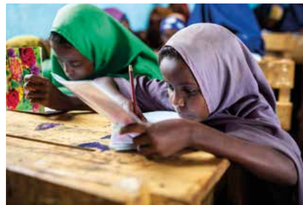
Somaliassa Yhteisvastuu tukee muun muassa lapsia, joiden perheet kuivuus on pakottanut siirtolaisiksi.

Vuonna 2020 Kirkon Ulkomaanapu tuki apua tarvitsevia yhteisvastuulahjoituksin maailmalla muun muassa järjestämällä koulutusta ja parantamalla vesihuoltoa.