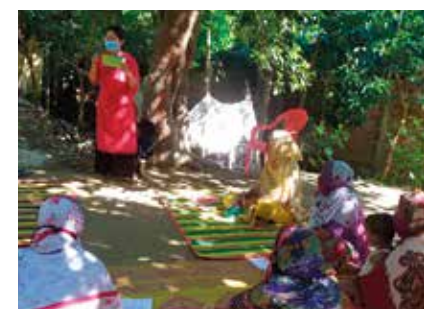
1750 Rohingya-naista pääsi koulutukseen Bangladeshissa.